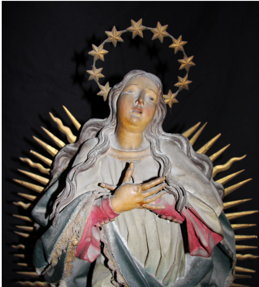
Fig. 6: Inmaculada Concepción (detalle), capilla de la Concepción, catedral de Santa María de Vitoria-Gasteiz

La obra debe situarse hacia finales del siglo XVII y probablemente se trate de la Virgen inventariada en 1695 en el oratorio de la casa de Tomás José de Velasco y su esposa Ana María de Jáuregui y Unzueta, descrita como “Una imagen de Nuestra Señora de la Concepción con su manto dorado y estofado, en su peana dorada”. 36 Es probable que tras la muerte de Tomás José de Velasco y el reparto de todos sus bienes, se decidiera llevar esta talla a la capilla familiar donde iba a ser enterrado, pues en los inventarios de bienes de los siguientes patronos de la capilla se deja de mencionar. Coincide plenamente con ese momento fervoroso que se produce en España durante el siglo XVII, sobre todo en el reinado de Felipe IV, en torno a la solicitud del dogma de la Inmaculada Concepción al Papa Alejandro VII. Esta situación creó un ambiente mariano fomentado por la monarquía y defendido por importantes órdenes religiosas como jesuitas, franciscanos y dominicos e incluso por escritores como Cervantes o Calderón. Fue durante este siglo cuando se crea un tipo iconográfico definido en el que comienzan a tener menos importancia las letanías, dando mayor relevancia a las cabezas aladas, la media luna o la serpiente, como podemos advertir en esta imagen. A partir de 1644 se introduce en España la fiesta de la Inmaculada Concepción, aunque no será declarada dogma de fe hasta 1854. 37