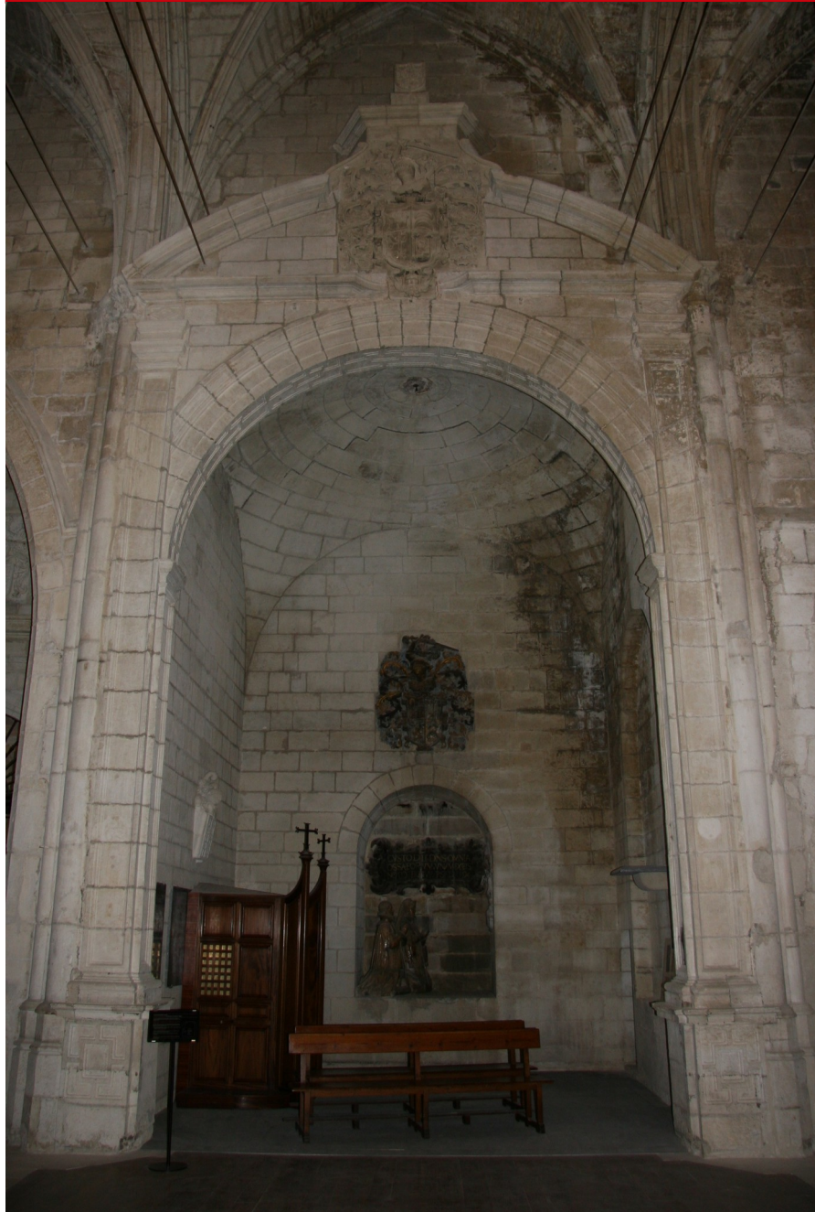
Fig. 2: Capilla de la Concepción de la catedral de Santa María de Vitoria-Gasteiz