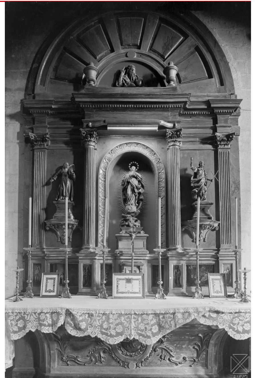
Fig. 3: Retablo de la capilla de la Concepción de la catedral de Santa María de Vitoria-Gasteiz. Archivo Municipal de Vitoria-Gasteiz Pilar Aróstegui. GUI-VIII-47_0. Enrique Guinea Maquibar